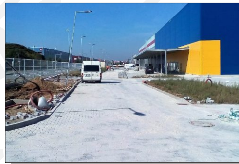
Zemní práce, hrubé terénní úpravy.