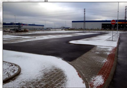
Komunikace - konstrukční a živичné vrstvy, asfaltové komunikace, zámkové dlažby.